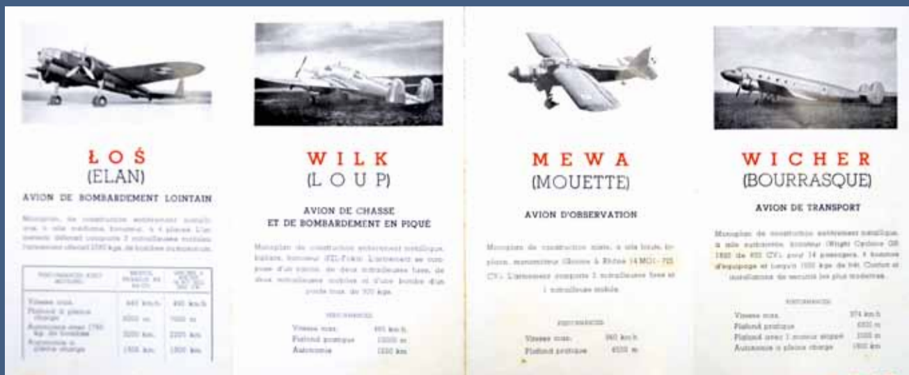
ULOTKA PAŃSTWOWYCH ZAKŁADÓW LOTNICZYCH