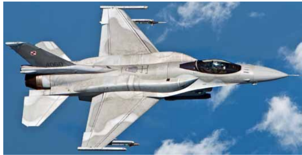
■ F-16 BLOCK 52+ W TRAKCIE ĆWICZEŃ ANTYTERRORYSTYCZNYCH RENEGADE 12

Po roku 1945 Dzień Lotnika świętowano w dwóch terminach: 1 września – w rocznicę wybuchu II wojny światowej oraz 23 sierpnia – w rocznicę pierwszych walk myśliwców z 1 Pułku Lotnictwa Myśliwskiego na przyczółku warecko-magnuszewskim w 1944 r.