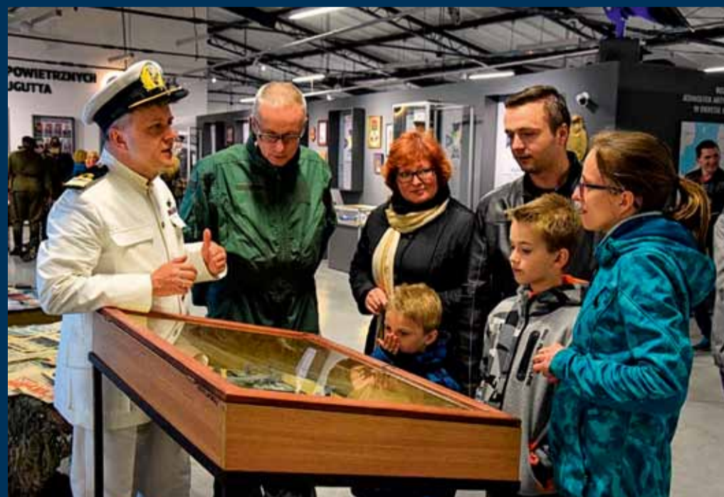
■ STANOWISKO BAŁTYCKIEGO STOWARZYSZENIA MIŁOŚNIKÓW HISTORII PERUN