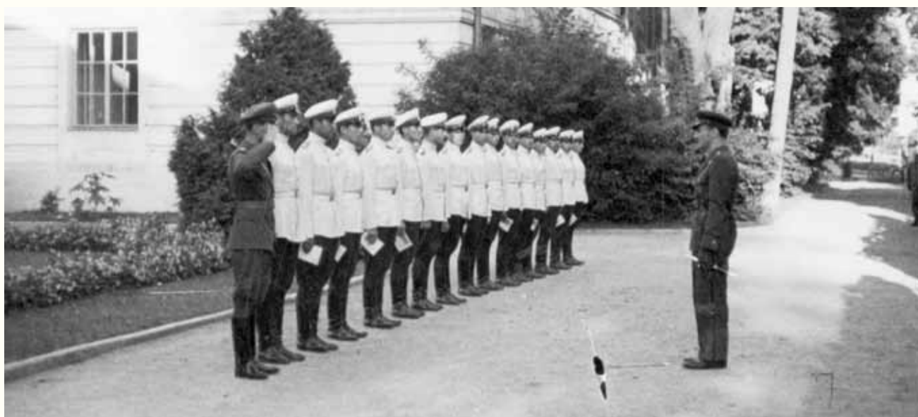
■ ZBIÓRKA OFICERÓW BUŁGARSKICH NA TERENIE SZKOŁY PODCHORĄŻYCH LOTNICTWA W DĘBLINIE 1938 R.

Zamierzeniem naszej wyprawy było zebranie materiałów archiwalnych o współpracy polsko-bułgarskiej w dziedzinie lotnictwa w okresie przedwojennym, nawiązanie współpracy z bułgarskimi historykami i badaczami tej tematyki a także przywiezienie tablicy upamiętniającej głównych decydentów tej współpracy