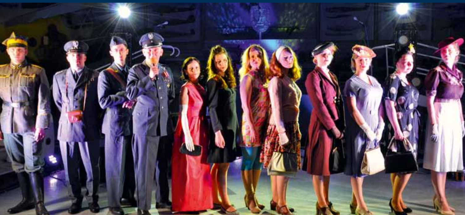
■ GRH BLUSZCZ I WOLANT