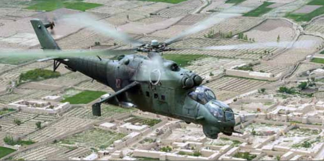
■ ŚMIGŁOWIEC BOJOWY MI-24 W TRAKCIE WYKONYWANIA ZADANIA BOJOWEGO W AFGANISTANIE