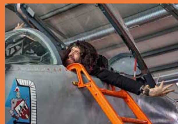
Noc w muzeum

15 SIERPNI A zapraszamy na Letnią Noc w Muzeum. W programie m.in. specjalny program artystyczny ojca polskiej muzyki elektronicznej Władysława Komendarka.