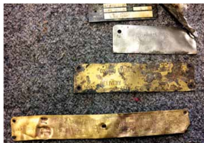
■ TABLICZKI ZNAMIONOWE