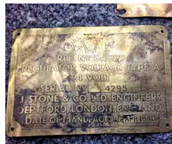
■ TABLICZKA ZNAMIONOWA REGULATORY NAPIĘCIA