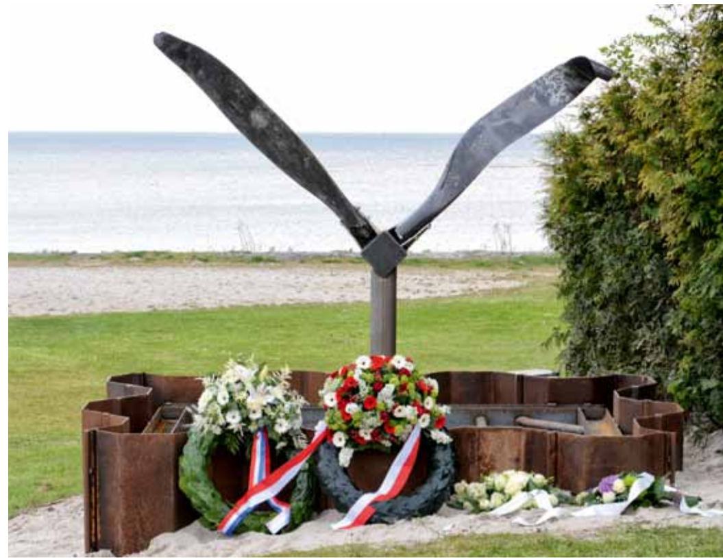
■ POMNIK WSKAZUJĄCY MIEJSCE WYDOBYCIA WRAKU

Akcja poszukiwawcza oraz ogrom środków i pracy, jakie ten projekt pochłoniął są niesłychanie ważne, przede wszystkim dla rodzin ofiar. Fakt zaangażowania się w akcję Królewskiej Armii Holenderskiej oraz Skautów Morskich świadczy o tym, jak wielkie znaczenie, również edukacyjne, dla młodzieży i całego społeczeństwa Holandii miało to odkrycie. Media holenderskie i światowe poświęciły dużo uwagi całemu projektowi, co znacznie zwiększyło świadomość udziału polskich lotników w zmaganiach II wojny światowej. Celem Muzeum Sił Powietrznych w Dęblinie jest kontynuacja tej pracy oraz dalsze godne upamiętnienie lotników.