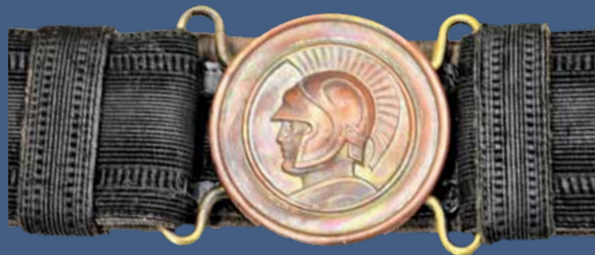
LOTNICZY PAS SALONOWY WZ. 28