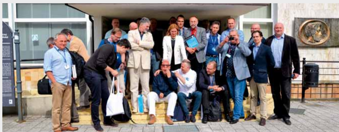
■ UCZESTNICY KONFERENCJI W KOSZALINIE

W imieniu wymienionych tu instytucji zapraszam już teraz do Koszalina, na kolejną edycję Historii Skrzydłami Malowanej , która mamy nadzieję, że odbędzie się w 2018 roku w równie atrakcyjnym składzie. Nad zaskakującym tematem przyszłorocznych referatów myślą już tęgie głowy zarówno w Fundacji Historycznej Lotnictwa Polskiego jak i w Muzeum Sił Powietrznych.