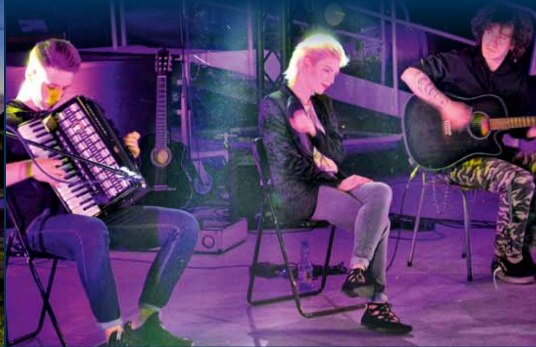
■ ZESPÓŁ BLEACH

uprawniają do bezpłatnego zwiedzenia Muzeum Sił Powietrznych w Dęblinie. W trakcie całego programu nasi goście zwiedzali nowo otwartą wystawę stałą „Historia polskiej broni przeciwlotniczej”.