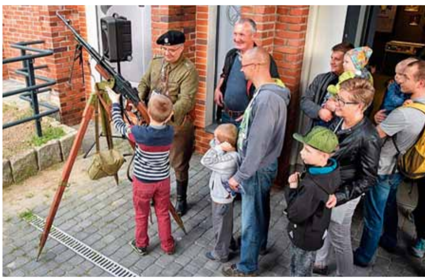
■ NOC MUZEÓW 2017 STANOWISKO BAŁTYCKIEGO STOWARZYSZENIA MIŁOŚNIKÓW HISTORII PERUN