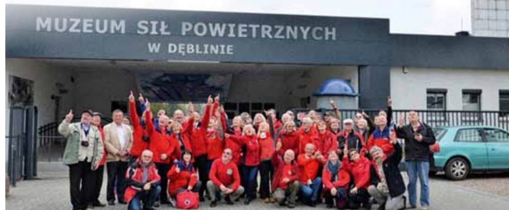
SESYJA SZKOLENIOWA W MUZEUM SIŁ POWIETRZNYCH