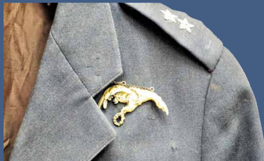
KURTKA MUNDUROWA Z GAPĄ J. KNEDLERA