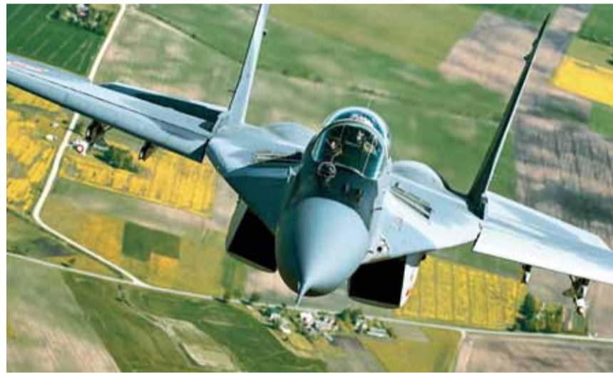
■ SAMOLOT MYŚLIWSKI MiG-29 W TRAKCIE REALIZACJI ZADAŃ W MISJI AIR POLICING NAD LITWĄ

lata 2013–2022 realizację wielu zadań z zakresu doposażenia polskiego lotnictwa wojskowego. Zakupione kilka lat temu nowoczesne samoloty wielozadaniowe F-16 C/d block 52+ osiągnęły już gotowość bojową. Trwa modernizacja myśliwców MiG-29, które z powodzeniem realizują misję Air Policing w państwach nadbałtyckich. Modernizuje się również śmigłowce PZL W-3 do standardu W-3pl Głuszc. Zakupione samoloty transportowe C-295m CASA dostarczają sprzęt i uzbrojenie w rejonach działań polskich kontyngentów wojskowych. Siły powietrzne wybrały nowy samolot szkolenia zaawansowanego