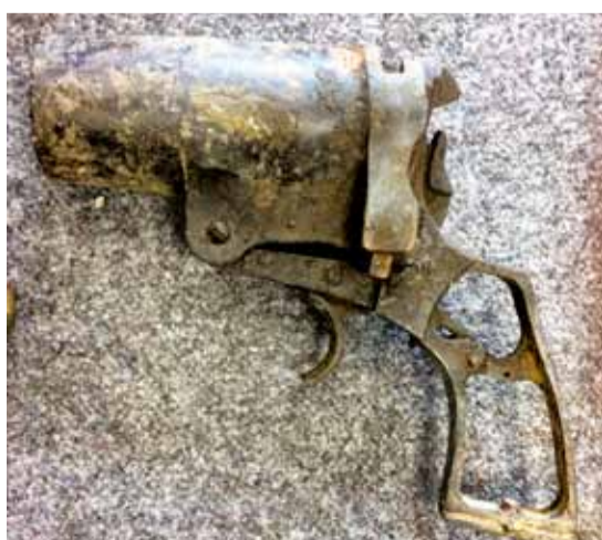
■ PISTOLET SYGNAŁOWY