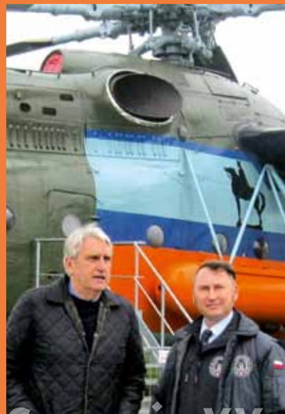
Sensacje XX wieku

8 MAJA gościliśmy Bogusława Wołoszańskiego – dziennikarza i popularyzatora historii, autora wielu książek o tematyce historycznej, autora kultowego programu telewizyjnego Sensacje XX wieku . Celem wizyty był rekonosans w terenie i zebranie dokumentacji do nowego programu telewizyjnego, w którym wykorzystane będą wątki historyczne związane z Dęblinem i okolicami.