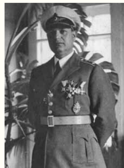
■ GENERAL MAJOR KONSTANTIN UZUNSKI SZEF SZTABU WOJSK POWIETRZNYCH W SWOIM GABINECIE