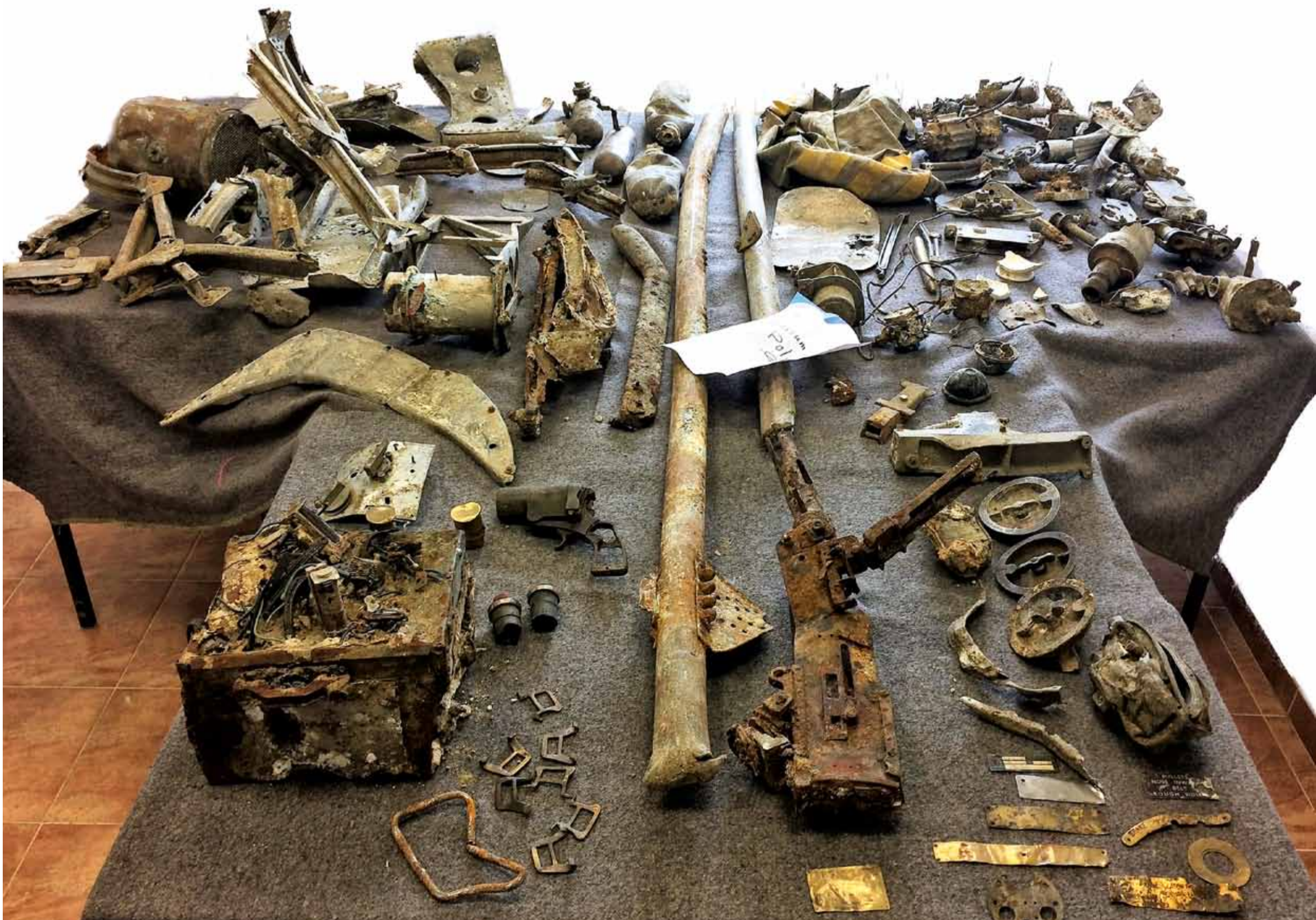
■ SZCZĄTKI BOMBOWCA VICKERS WELLINGTON IC NR R1322 SM-F, KTÓRE TRAFIŁY DO MUZEUM SIŁ POWIETRZNYCH W DĘBLINIE