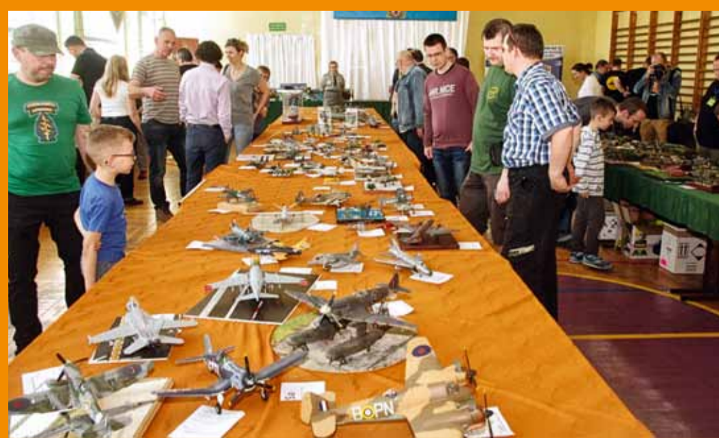
■ PREZENTACJE MODELI BUDZIŁY DUŻE ZAINTERESOWANIE WIDZÓW

Już dzisiaj zapraszamy do Koszalina na siódmą edycję Bałtyckiego Festiwalu Modelarskiego w dniach 26–27.05.2018 r., pod hasłem przewodnim: Stulecie polskiego lotnictwa .