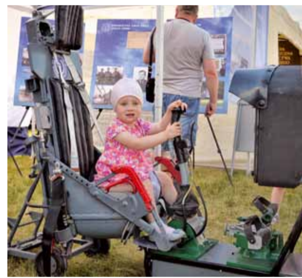
■ STOISKO MUZEUM SIŁ POWIETRZNYCH – MŁODA KADRA, LOTNICZE DEPUTYCZE 2017