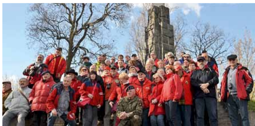
PODRÓŻ STUDYJNA, UCZESTNICY PRZED POMNIKIEM 15. PUŁKU PIECHOTY WILKÓW