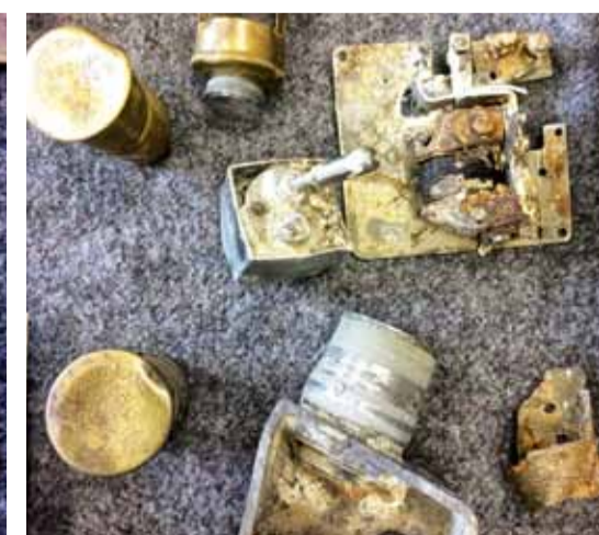
■ ELEMENTY WYPOSAŻENIA KOKPITU I CZĘŚĆ FOTOKARABINU