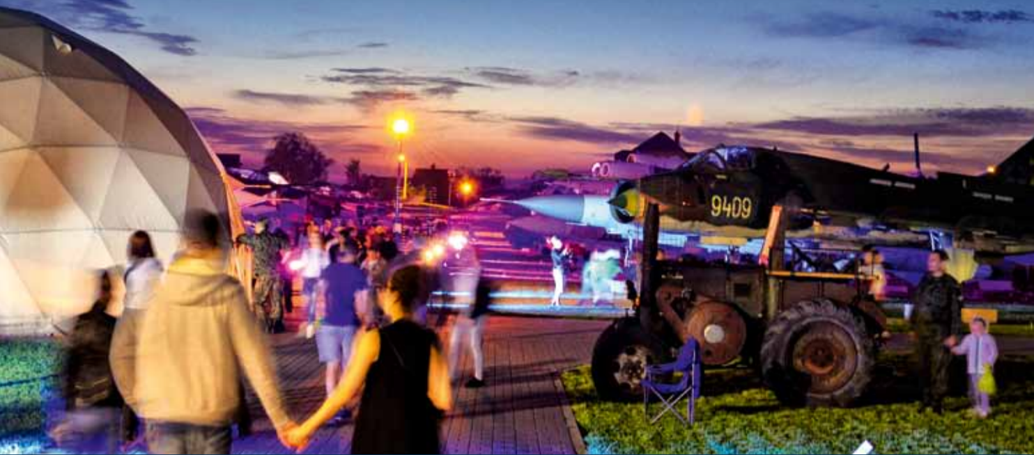
■ EUROPEJSKA NOC MUZEÓW W MUZEUM SIŁ POWIETRZNYCH W DĘBLINIE – ILUMINACJA

Wyjątkowy charakter miała muzealna noc w Muzeum Sił Powietrznych. Wystawy stałe i czasowe były udostępniane zwiedzającym wraz z towarzyszącym programem edukacyjno-artystycznym. W sobotę 20 maja 2017 r. liczna grupa miłośników historii przybyła do naszych placówek w Dęblinie i Koszalinie, by zobaczyć zabytki w innym świetle, a także by wspólnie z nami uczcić święto muzealników.