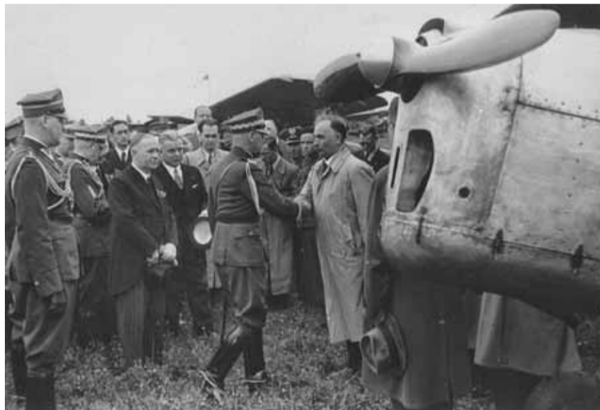
■ MARSZAŁEK EDWARD ŚMIGŁY-RYDZ PODCZAS UROCZYSTOŚCI PRZEKAZANIA WOJSKU SAMOLOTÓW SZKOLNYCH RWD-8 UFUNDOWANYCH ZE SKŁADEK LOPP. ŚWIDNIK, 1939 R.

W czerwcu 2017 roku do służby w polskich siłach zbrojnych wprowadzono samolot Gulfstream G550, który został przebazowany do 1. Bazy Lotnictwa Transportowego w Warszawie.