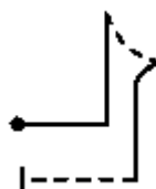
ślizg na ogon przez "plecy"

PYTANIE 46 (Dotyczy: Załącznik nr 1: PROJEKT ARANŻACJI WNEŹTRZ, Funkcje pomieszczenia nr 5):