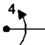
beczka sterowana akcentowana