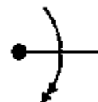
beczka superwolna (czas obrotu > 10s na obrót)